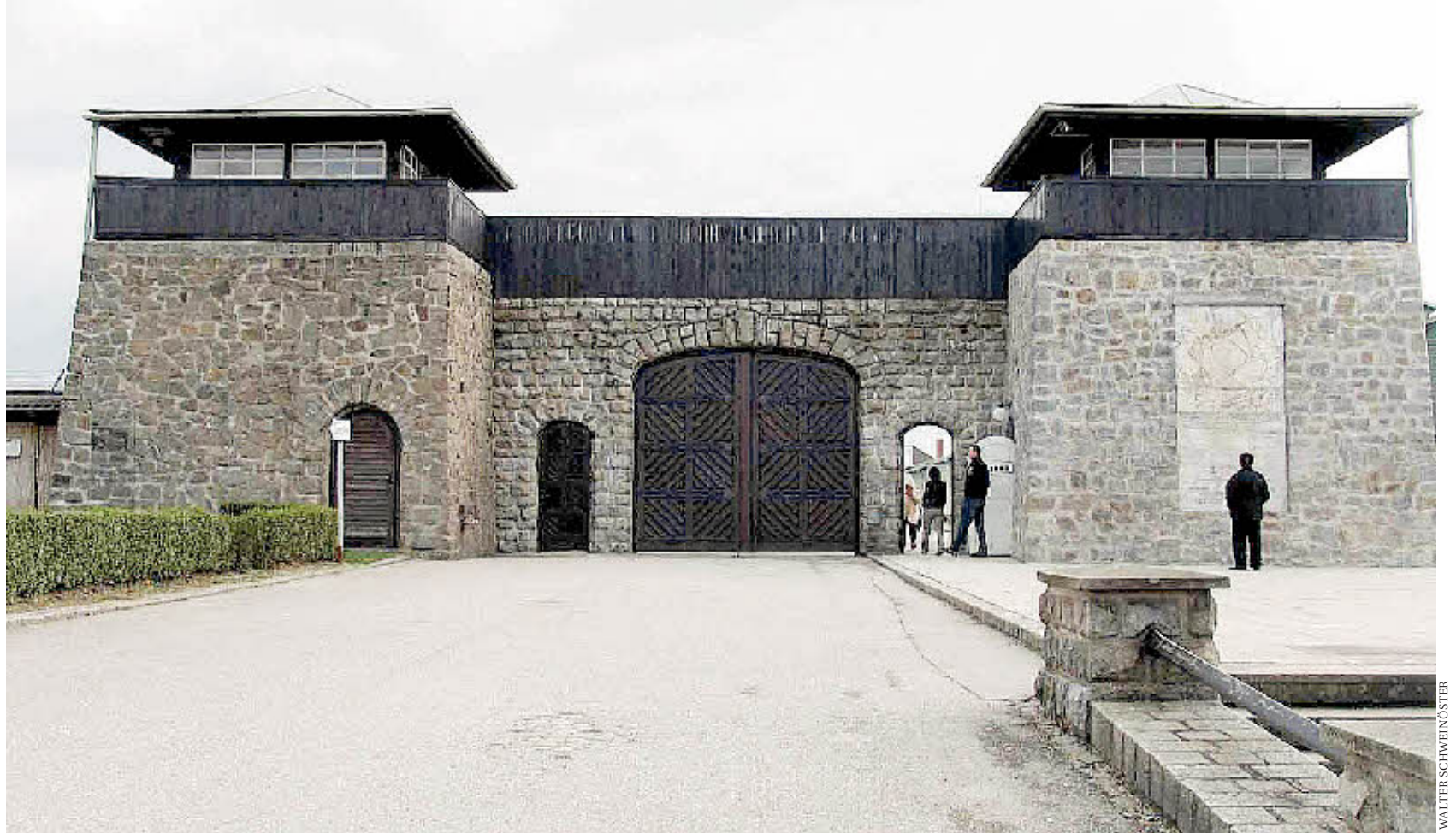
Im Konzentrationslager Mauthausen (Bild) sind laut aktuellen wissenschaftlichen Erkenntnissen ab März 1942 mindestens 3455 Menschen mit „Zyklon B“ vergast worden